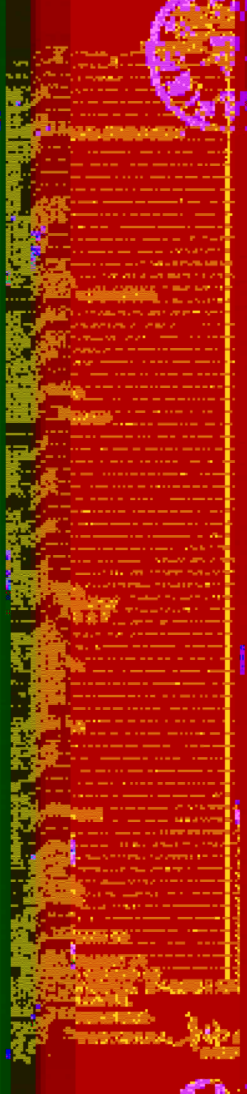
表 未 附 位